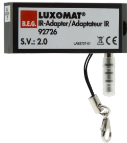
IR-Adapter für Smartphones Art.No: 92726

Abmessungen: 40 x 55 x 103 mm Farbe: schwarz Frequenz: 2.4 GHz ISM-Band, GFSK 0.2 dBm + 5.3 dBi = 5.5 dBm