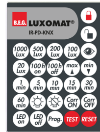
IR-PD-KNX Art.No: 92123

Abmessungen: 47 x 19 x 10 mm Schutzart/-klasse: IP20 Umgebungstemperatur: -20 °C bis +40 °C