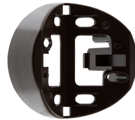
Außen-Ecksockel RC-plus next Art.No: 97014

Batterie: 3.0 V Lithium CR2032 (inklusive) Abmessungen: 57 x 35 x 7 mm Farbe: -