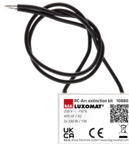
RC-Loeschglied Art.No: 10880

Batterie: 3.0 V Lithium CR2032 (inklusive) Abmessungen: 57 x 35 x 7 mm Farbe: -