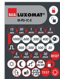
IR-PD-1C-E Art.No: 92077

Batterie: 3.0 V Lithium CR2032 (inklusive) Abmessungen: 80 x 60 x 8 mm Farbe: -