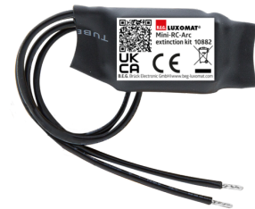
Mini-RC-Loeschglied Art.No: 10882

Spannung: 230 V AC \pm 10\% Abmessungen: 38 x 12 x 26 mm Schutzart/-klasse: IP20 / Klasse II