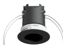
Montageset PICO Art.No: 93776

Abmessungen: Ø 45 x 50 mm Schutzart/-klasse: IP20 Gehäuse: Polycarbonat, UV-beständig