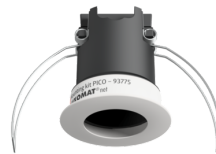
Montageset PICO Art.No: 93775

Batterie: 3.0 V Lithium CR2032 (inklusive) Abmessungen: 57 x 35 x 7 mm Farbe: -