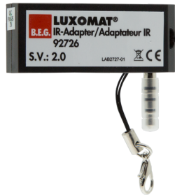
IR-Adapter für Smartphones Art.No: 92726

Abmessungen: 40 x 55 x 103 mm Farbe: schwarz Frequenz: 2.4 GHz ISM-Band, GFSK 0.2 dBm + 5.3 dBi = 5.5 dBm