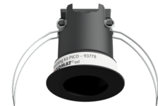
Montageset PICO Art.No: 93778

Abmessungen: Ø 45 x 50 mm Schutzart/-klasse: IP20 Gehäuse: Polycarbonat, UV-beständig