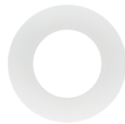
Abdeckring PD9 Ø 36 mm Art.No: 92238

Abmessungen: Ø 36 mm Gehäuse: Polycarbonat, UV- beständig Farbe: anthrazit glänzend