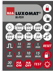
IR-PD9 Art.No: 92201

Abmessungen: 40 x 55 x 103 mm Farbe: schwarz Frequenz: 2.4 GHz ISM-Band, GFSK 0.2 dBm + 5.3 dBi = 5.5 dBm