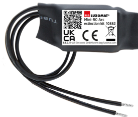
Mini-RC-Loeschglied Art.No: 10882

Spannung: 230 V AC ±10% Abmessungen: 38 x 12 x 26 mm Schutzart/-klasse: IP20 / Klasse II