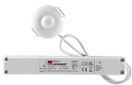
PD9-1C-DE Art.No: 92902

Um das Set gemäß der technischen Spezifikation zu erhalten, bestellen Sie bitte die aufgeführten Artikel.