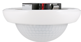
PD4N-KNXs-DX-UP Art.No: 93517

Um das Set gemäß der technischen Spezifikation zu erhalten, bestellen Sie bitte die aufgeführten Artikel.