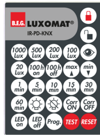
IR-PD-KNX Art.No: 92123

Abmessungen: 40 x 55 x 103 mm Farbe: schwarz Frequenz: 2.4 GHz ISM-Band, GFSK 0.2 dBm + 5.3 dBi = 5.5 dBm