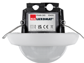
PD4N-CAS Art.No: 93474

Um das Set gemäß der technischen Spezifikation zu erhalten, bestellen Sie bitte die aufgeführten Artikel.