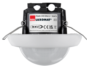
PD4N-CAS DALI-2 Art.No: 93473

Um das Set gemäß der technischen Spezifikation zu erhalten, bestellen Sie bitte die aufgeführten Artikel.