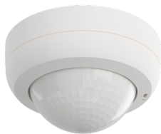
PD4N-1C-K-AP Art.No: 92270

Um das Set gemäß der technischen Spezifikation zu erhalten, bestellen Sie bitte die aufgeführten Artikel.