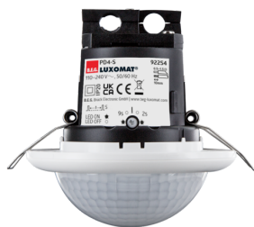
PD4-S-DE Art.No: 92254

Um das Set gemäß der technischen Spezifikation zu erhalten, bestellen Sie bitte die aufgeführten Artikel.