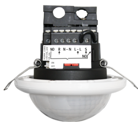
PD4-M-1C-K-DE Art.No: 92586

Um das Set gemäß der technischen Spezifikation zu erhalten, bestellen Sie bitte die aufgeführten Artikel.