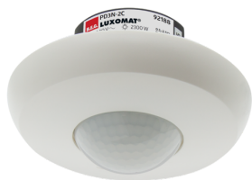
PD3N-2C-UP Art.No: 92188

Um das Set gemäß der technischen Spezifikation zu erhalten, bestellen Sie bitte die aufgeführten Artikel.