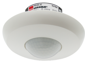
PD3N-2C-UP Art.No: 92188

Um das Set gemäß der technischen Spezifikation zu erhalten, bestellen Sie bitte die aufgeführten Artikel.