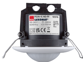
PD3N-1C-NO-PF-DE Art.No: 92576

Um das Set gemäß der technischen Spezifikation zu erhalten, bestellen Sie bitte die aufgeführten Artikel.