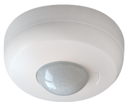
PD3N-1C-AP Art.No: 92190

Um das Set gemäß der technischen Spezifikation zu erhalten, bestellen Sie bitte die aufgeführten Artikel.