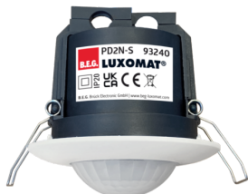
PD2N-S Art.No: 93240

Um das Set gemäß der technischen Spezifikation zu erhalten, bestellen Sie bitte die aufgeführten Artikel.