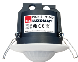
PD2N-S Art.No: 93240

Um das Set gemäß der technischen Spezifikation zu erhalten, bestellen Sie bitte die aufgeführten Artikel.