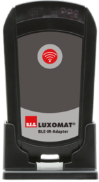
BLE-IR-Adapter Art.No: 93067

Abmessungen: 40 x 55 x 103 mm Farbe: schwarz Frequenz: 2.4 GHz ISM-Band, GFSK 0.2 dBm + 5.3 dBi = 5.5 dBm