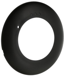
Abdeckring PD2N DE Art.No: 93773

Batterie: 3.0 V Lithium CR2032 (inklusive) Abmessungen: 57 x 35 x 7 mm Farbe: -