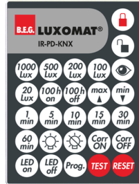
IR-PD-KNX Art.No: 92123

Abmessungen: 40 x 55 x 103 mm Farbe: schwarz Frequenz: 2.4 GHz ISM-Band, GFSK 0.2 dBm + 5.3 dBi = 5.5 dBm