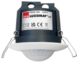
PD2N-CAS Art.No: 93477

Um das Set gemäß der technischen Spezifikation zu erhalten, bestellen Sie bitte die aufgeführten Artikel.