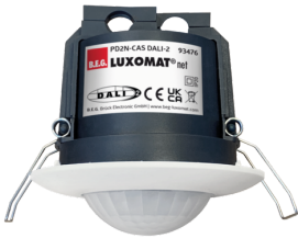
PD2N-CAS DALI-2 Art.No: 93476

Um das Set gemäß der technischen Spezifikation zu erhalten, bestellen Sie bitte die aufgeführten Artikel.