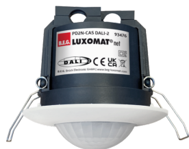
PD2N-CAS DALI-2 Art.No: 93476

Um das Set gemäß der technischen Spezifikation zu erhalten, bestellen Sie bitte die aufgeführten Artikel.