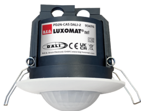
PD2N-CAS DALI-2 Art.No: 93476

Um das Set gemäß der technischen Spezifikation zu erhalten, bestellen Sie bitte die aufgeführten Artikel.