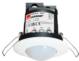
PD2-M-2C-DE Art.No: 92165

Um das Set gemäß der technischen Spezifikation zu erhalten, bestellen Sie bitte die aufgeführten Artikel.