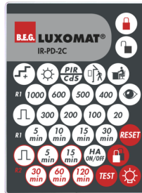
IR-PD-2C Art.No: 92475

Abmessungen: 40 x 55 x 103 mm Farbe: schwarz Frequenz: 2.4 GHz ISM-Band, GFSK 0.2 dBm + 5.3 dBi = 5.5 dBm