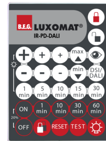
IR-PD-DALI Art.No: 92094

Abmessungen: 47 x 19 x 10 mm Schutzart/-klasse: IP20 Umgebungstemperatur: -20 °C bis +40 °C