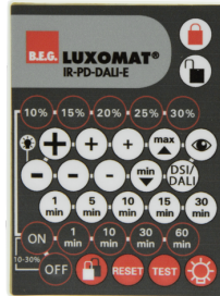
IR-PD-DALI-E Art.No: 92122

Batterie: 3 x 1.5 V Micro AAA (nicht im Lieferumfang) Abmessungen: 83 x 53 x 17 mm Farbe: -