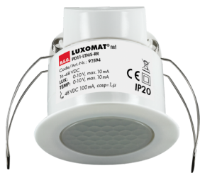
PD11-LTMS-RR-DE Art.No: 92594

Um das Set gemäß der technischen Spezifikation zu erhalten, bestellen Sie bitte die aufgeführten Artikel.