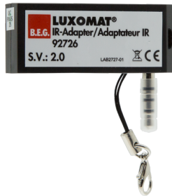
IR-Adapter für Smartphones Art.No: 92726

Abmessungen: 40 x 55 x 103 mm Farbe: schwarz Frequenz: 2.4 GHz ISM-Band, GFSK 0.2 dBm + 5.3 dBi = 5.5 dBm