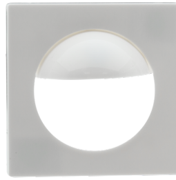
Zentralplatte Indoor 180 55 x 55 mm Art.No: 39222

Abmessungen: 45 x 45 mm Gehäuse: Polycarbonat, UV-beständig Farbe: perlweiß matt, ähnlich RAL1013