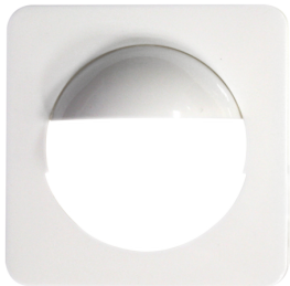
Zentralplatte Indoor 180 56x56 Modul2 Art.No: 35127

Abmessungen: 56 x 56 mm Gehäuse: Polycarbonat, UV-beständig Farbe: reinweiß glänzend, ähnlich RAL9010