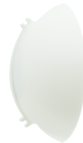
Abdecklamelle Indoor 180 Art.No: 33233

Gehäuse: Polycarbonat, UV-beständig Farbe: weiß