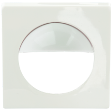
Zentralplatte Indoor 180 55 x 55 mm Art.No: 39241

Abmessungen: 55 x 55 mm Gehäuse: Polycarbonat, UV-beständig Farbe: verkehrsweiß glänzend