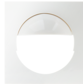
Zentralplatte Indoor 180 S1 56x56 Art.No: 35126

Abmessungen: 55 x 55 mm Gehäuse: Polycarbonat, UV-beständig Farbe: verkehrsweiß glänzend, ähnlich RAL9016