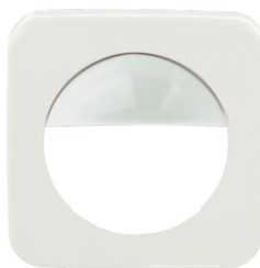
Zentralplatte Indoor 180 55x55 Art.No: 39242

Abmessungen: 55 x 55 mm Gehäuse: Polycarbonat, UV-beständig Farbe: signalweiß glänzend, ähnlich RAL9003