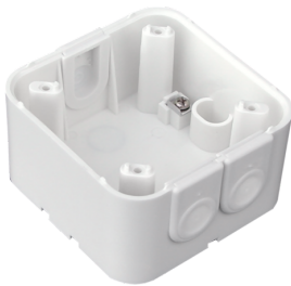
Aufputzdose Indoor 180 Art.No: 92141

Abmessungen: 86 x 86 mm Schutzart/-klasse: IP20 Gehäuse: Polycarbonat, UV- beständig