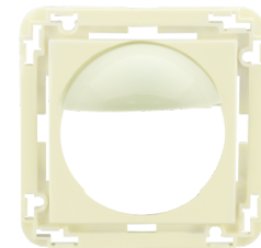
Zentralplatte Indoor 180 45x45 Art.No: 39076

Abmessungen: 45 x 45 mm Farbe: verkehrsweiß matt, ähnlich RAL9016