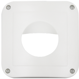
Rahmen IP54 Indoor 180 Art.No: 92139

Abmessungen: 86 x 86 mm Schutzart/-klasse: IP20 Gehäuse: Polycarbonat, UV- beständig