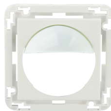
Zentralplatte Indoor 180 45x45 Art.No: 38947

Abmessungen: 88 x 88 x 42 mm Schutzart/-klasse: IP54 Stoßfestigkeitsgrad: IK05