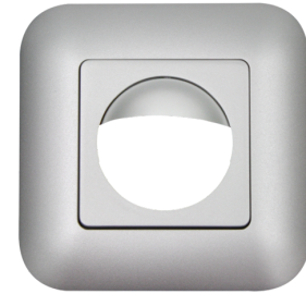
Rahmen IP20 Indoor 180 Art.No: 92633

Abmessungen: 86 x 86 mm Schutzart/-klasse: IP20 Gehäuse: Polycarbonat, UV- beständig