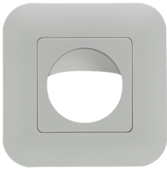
Rahmen IP20 Indoor 180 Art.No: 92630

Abmessungen: 86 x 86 mm Schutzart/-klasse: IP20 Gehäuse: Polycarbonat, UV- beständig