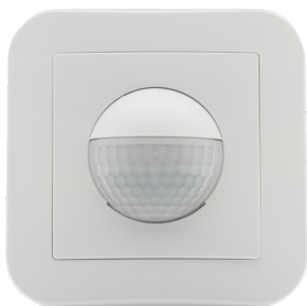
Indoor 180-R-11-48V-3A mit Rahmen Art.No: 92621

Um das Set gemäß der technischen Spezifikation zu erhalten, bestellen Sie bitte die aufgeführten Artikel.