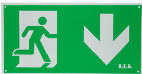
Piktogramm DT32-LED Pfeil nach unten Art.No: 8785

Abmessungen: 170 x 330 x 1 mm Gehäuse: Kunststoff Farbe: grün