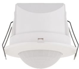
BL2-PLUS-DE Art.No: 93405

Um das Set gemäß der technischen Spezifikation zu erhalten, bestellen Sie bitte die aufgeführten Artikel.