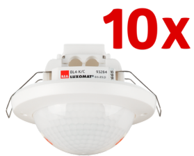
10 x BL4-K-DE Art.No: 93231

Um das Set gemäß der technischen Spezifikation zu erhalten, bestellen Sie bitte die aufgeführten Artikel.