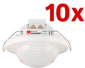
10 x BL4-K-DE Art.No: 93231

Um das Set gemäß der technischen Spezifikation zu erhalten, bestellen Sie bitte die aufgeführten Artikel.