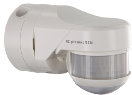
RC-plus next N 230 KNXs-DX Art.no: 93527

For at få sættet i henhold til den tekniske specifikation skal du bestille de anførte varer.