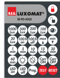
IR-PD-KNX Art.No: 92123

Dimensioner: 47 x 19 x 10 mm Beskyttelsesgrad/-klasse: IP20 Omgivelsestemperatur: -20 °C til +40 °C