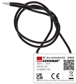
RC-dæmperled Art.No: 10880

Spænding: 230 V AC \pm 10\% Dimensioner: 38 x 12 x 26 mm Beskyttelsesgrad/-klasse: IP20 / Klasse II