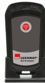
BLE-IR-Adapter Art.No: 93067

Spænding: 230 V AC ±10% Dimensioner: 50 x 23 x 8 mm Beskyttelsesgrad/-klasse: IP20 / Klasse II