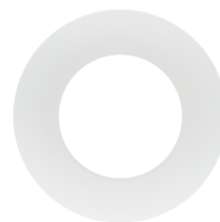
Afdækningsring PD9 Ø 36 mm Art.No: 92238

Beskyttelsesgrad/-klasse: IP65 Kabinet: UV-resistent Materiale Farve: transparent