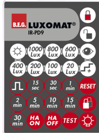
IR-PD9 Art.no: 92201

Dimensioner: 40 x 55 x 103 mm Materiale Farve: sort Frekvens: 2.4 GHz ISM band, GFSK 0.2 dBm + 5.3 dBi = 5.5 dBm