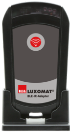
BLE-IR-Adapter Art.no: 93067

Dimensioner: Ø 36 mm Kabinet: UV-resistent polycarbonat af høj kvalitet Materiale Farve: sølv blank