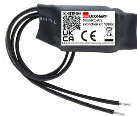
Mini-RC-dæmperled Art.no: 10882

Spænding: 230 V AC ±10% Dimensioner: 38 x 12 x 26 mm Beskyttelsesgrad/-klasse: IP20 / Klasse II