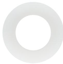
Afdækningsring PD9 Ø 36 mm Art.no: 92238

Dimensioner: Ø 36 mm Kabinet: UV-resistent polycarbonat af høj kvalitet Materiale Farve: antracit blank