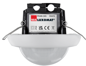
PD4N-CAS Art.no: 93474

For at få sættet i henhold til den tekniske specifikation skal du bestille de anførte varer.