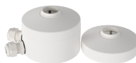
Sæt til montering af pendul PD2/3/4 P Art.no: 93179

Dimensioner: Ø 200 x 90 mm Beskyttelse mod slag: IK09 Kabinet: Coated stålcurv