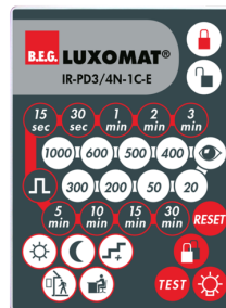
IR-PD3/4N-1C-E Art.no: 93110

Batteri: 3.0 V Lithium CR2032 inklusiv Dimensioner: 80 x 60 x 8 mm Materiale Farve: -