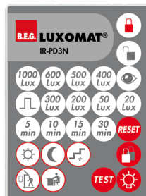
IR-PD3N Art.no: 92105

Dimensioner: 47 x 19 x 10 mm Beskyttelsesgrad/-klasse: IP20 Omgivelsestemperatur: -20 °C til +40 °C