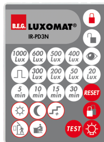
IR-PD3N Art.No: 92105

Dimensioner: 47 x 19 x 10 mm Beskyttelsesgrad/-klasse: IP20 Omgivelsestemperatur: -20 °C til +40 °C